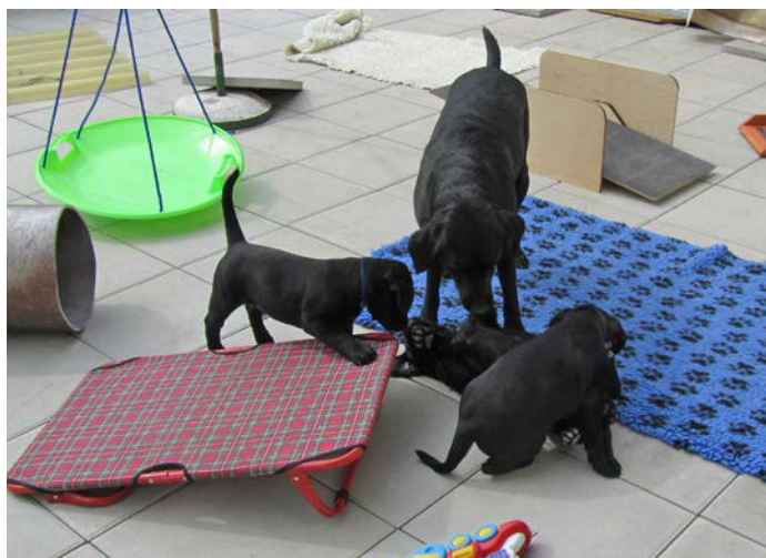
Das Welpenspiel dient zum Erlernen der Beißhemmung.