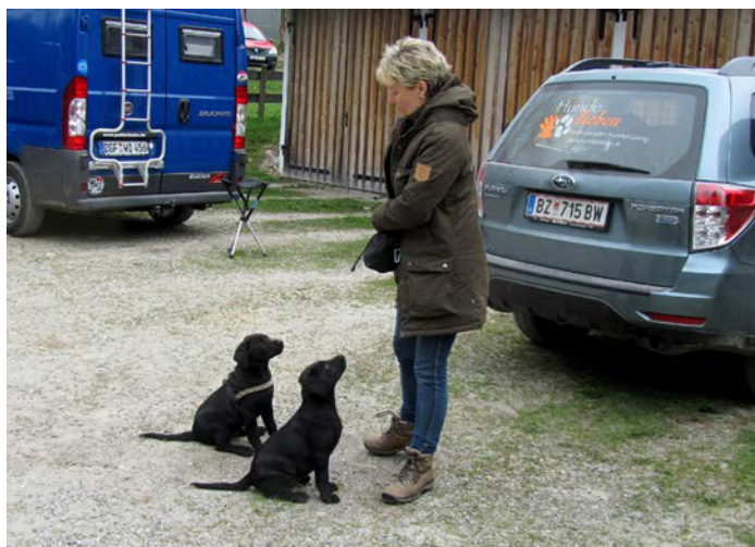
Die Motivation, mit dem Halter zu arbeiten, sollte stetig wachsen, niedliche Welpen-Marotten müssen wieder abgebaut werden.