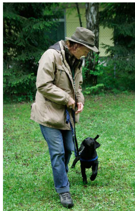
Die Früherziehung beginnt genau in dem Moment, in dem wir den Welpen bei uns im Haus haben. Schon mit 8 Wochen kann der Welpe spielerisch in vielen, kleinen Einheiten sehr viel Grundlegendes lernen.