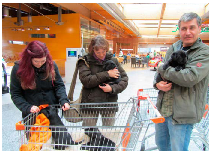
Der neue Halter hat die wertvolle Aufgabe, die vom Züchter gemachte Sozialisation und Habituation weiterzuführen.